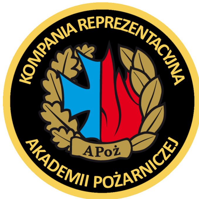
Rys. 1. Emblemat Kompanii Reprezentacyjnej APoż