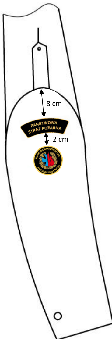
Rys. 3. Sposób noszenia emblematu Kompanii Reprezentacyjnej APOż na marynarce munduru

7. Sposób noszenia emblematu Kompanii Reprezentacyjnej APOż: