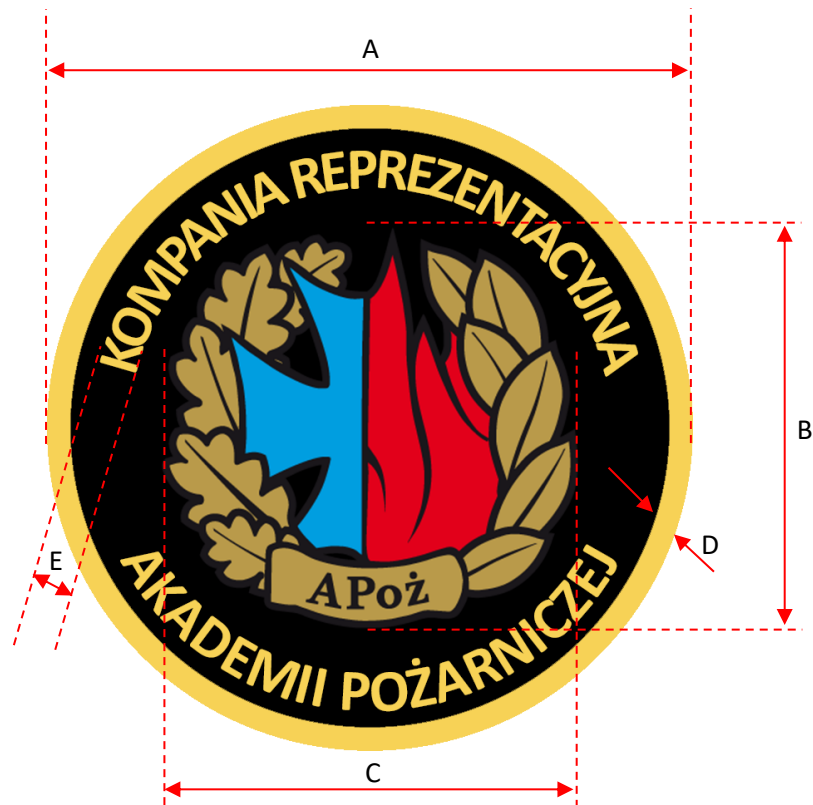
Rys. 2. Wymiarowanie emblematu Kompanii Reprezentacyjnej APoż